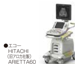
●エコー HITACHI (旧アロカ社製) ARIETTA60